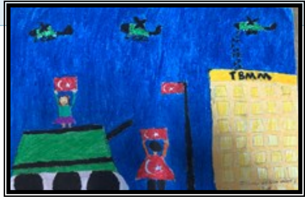
Zeynep Gülçin GÜNEŞ 7/B