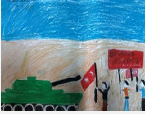
Hilal ATALAY 7/B