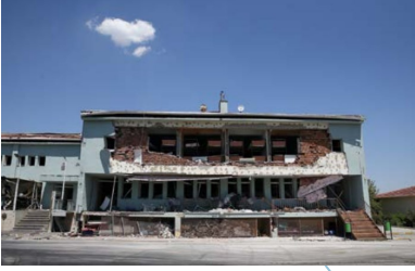
Darbecilerin özellikle en ağır silahlarla havadan ve karadan bombaladığı, 50 şehit verdiğimiz Özel Harekât Daire Başkanlığı şu an kullanılamayacak durumda