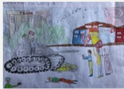
Elif Sefa 8/B