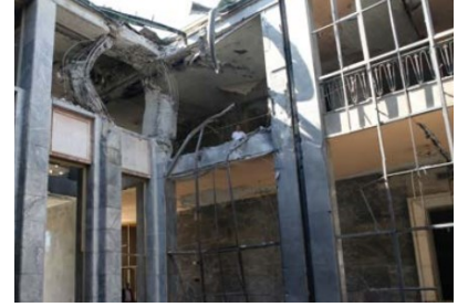
TBMM'ye atılan bomba nedeniyle bazı polis memurlarıyla Meclis görevlileri yaralandı, kulis camları kırıldı.

15 Temmuz gecesi şehit kanları ile sulanmış bu topraklar 251 şehidi daha bağrına bastı. 15 Temmuz şehitlerimiz hiç unutulmayacaktır.