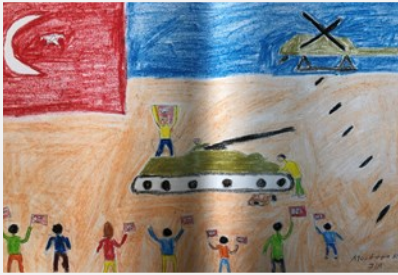
Mustafa KORU 7/B