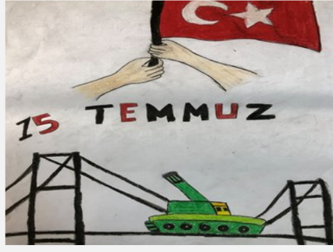
Sena KORKMAZ 7/A